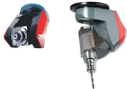
Ramię manipulatora 5D

Trwają prace nad własnym korpusem manipulatora pięcioosiowego. Dzięki temu nasi klienci zyskają możliwość zakupienia maszyny pięcioosiowej w znacznie niższej cenie niż dotychczas. Terazniejsze rozwiązanie jest budowane w oparciu o zewnętrzny układ sterowania jak i samą głowicę 5d. Dokonano już modernizacji układu sterowania jak i oprogramowania. Część mechaniczna jest wstępnie zaprojektowana bez uwzględnienia symulacji komputerowej. Koniec projektu przewidziany jest na koniec roku 2011.